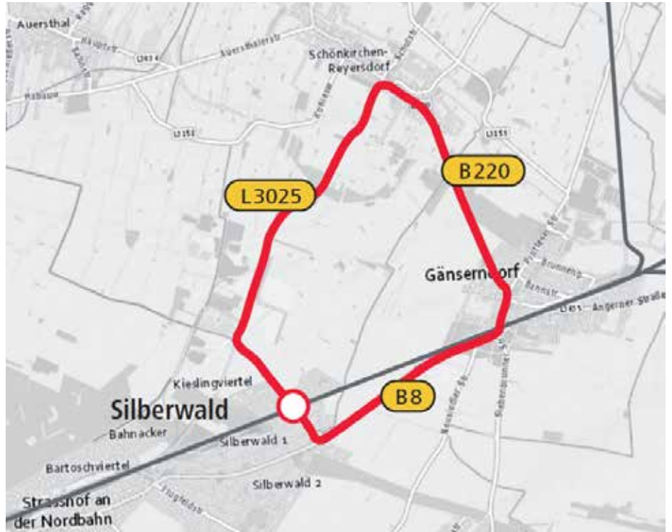
Eine beschilderte Umleitung wird eingerichtet, ÖBB-Infrastruktur GmbH

Während der Errichtung der Straßenunterführung kommt es zu Umleitungen und Einschränkungen im Straßennetz. Auch die betroffenen Buslinien des VOR werden ebenfalls umgeleitet.