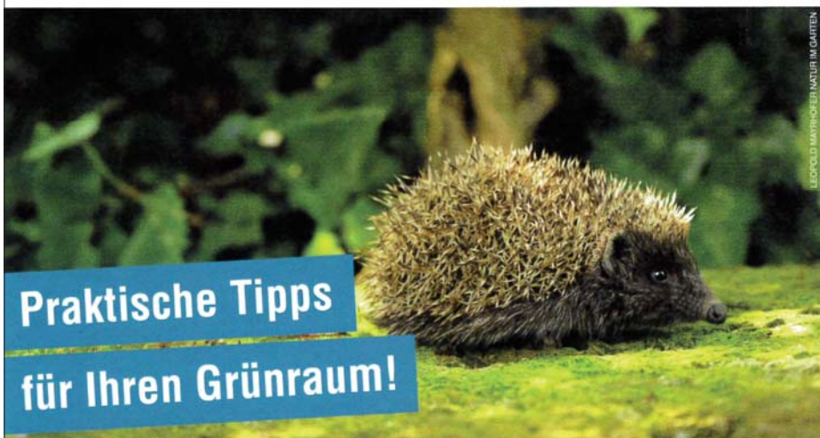
LEOPOLD WIRTHHOFFEN/MAURITZ IM GARTEN