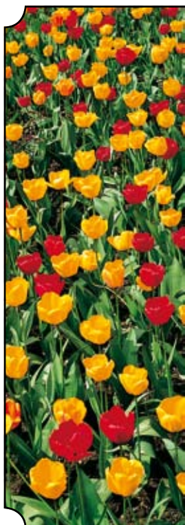
Ihr Erich Hofer

Ich wünsche uns allen einen guten Start in eine erfolgreiche Zukunft Auersthal's